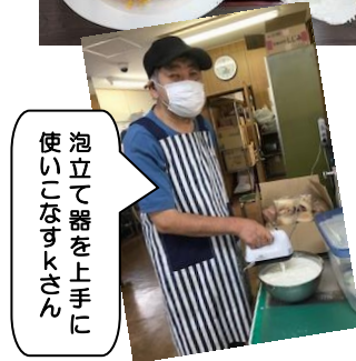
泡立て器を上手に使いこなすkさん