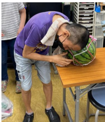
スイカの声を聞くFさん